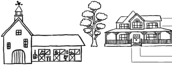
ФЕРМАТА НА ЛОГАН